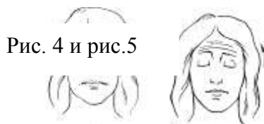
Рис. 4 и рис.5

Последнее упражнение заключается просто в поднимании бровей как можно выше. Глаза остаются закрытыми, а вы поднимаете брови как можно выше (рис. 5). Поднимите брови высоко. Еще выше. Гораздо выше. Гораздо выше. Подержите так и расслабьтесь. Повторите упражнение. Сделайте небольшую паузу, чтобы дать себе возможность ощутить расслабление лица (пауза 15 с).