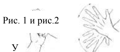
Рис. 1 и рис.2

Сожмите обе руки в кулаки (рис. 1). Сожмите кулаки очень крепко. Еще крепче. Подержите так и расслабьтесь. Повторите упражнение. Чтобы проработать противоположные мышцы, просто раздвиньте пальцы как можно шире (рис. 2). Подержите так и расслабьте. Повторите упражнение. Сосредоточьтесь на ощущениях тепла или покалывания в кистях рук и предплечьях (здесь пауза 20 с).